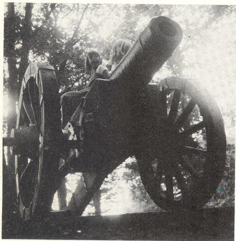
Het Grols Museum kan naast Vondels boek meer herinneringen aan dit bloedige tijdperk tonen. Buiten staat op een laatste stuk vestingwal het Spaanse kanon, door Frederik Hendrik na het innemen van de stad als trofee achtergelaten.