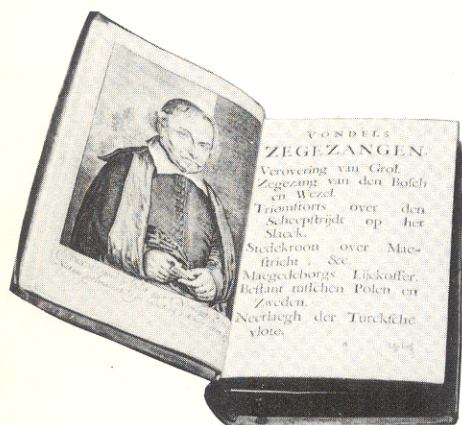
De tijdgenoten in het westen raakten niet uitgepraat over de definitieve verovering in 1627 van Grol en andere vestingen langs de oostgrens, waardoor de „tuin van Holland“ gesloten werd. Ook Vondel dichtte er over in zijn „Zegezangen“.