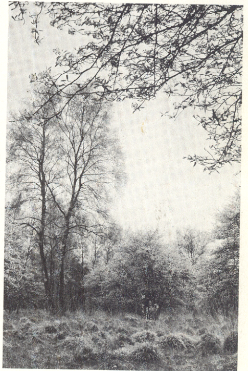
Het onland is inmiddels tot wat schamele restanten ingekrompen, zoals hier in het vroegere Noordijkerveld. Grotere stukken worden als natuurmonumenten gekoesterd. Bijvoorbeeld het Korenburgerveen-Vragenderveen, een complex komveen van 207 ha, waar het voor de turfwinning afgegraven veen weer aangroeit. Er worden regelmatig excursies georganiseerd, waarop parnassia, orchideeën en andere zeldzame planten te zien zijn. Dit is een heel andersoortig terrein dan de veel kleinere Winterswijkse beekbossen. Daarvan is ook een tiental in het bezit van de natuurbescherming.

Ook Westfaalse priesters, die op Nederlands gebied hun werk deden, kwamen vaak onzacht met de overheid in aanraking, maar het bezoek aan de kerk in Zwillbrock werd de inwoners van Grol en omgeving toch niet onmogelijk gemaakt, al hadden er wel kleinere pesterijen plaats. Die kwamen dan stevast van de kant van de wereldlijke en geestelijke overheid. Zij wogen niet op tegen het liefdewerk van de paters, die zich in heel de grensstreek zeer gezien hebben weten te maken. Dat Grol rooms is gebleven, betekent een monument voor hun meestal anoniem verrichte werk.