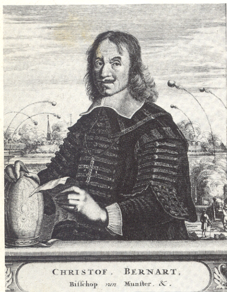
Vorst-bisschop Christoff Bernhard von Galen had zijn bijnaam Bommenberend te wijten aan het gebruik van de ontploffende ballen, waarmee hij zijn eigen stad Münster bestookte, die hem niet als regeerder had willen binnenlaten. Daarginds noemt men hem ook wel: den Kanonenbischop.

De enclave blijkt te liggen binnen een gordel van „onland”, die dit gebied in vroeger tijden een tamelijk geïsoleerde positie heeft gegeven. Daardoor kon er veel gebeuren, wat verborgen bleef voor de ogen van de protestantse overheid en haar ijverige „aanbrengers”, de fanatieke calvinistische dominees.