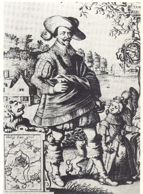
Stedendwinger Frederik Hendrik wordt op een statieportret geflankeerd door een voorstelling van 'tbeleg van Grol'.

Eenentwintig jaar van katholiek herstel na een hervorming, die alleen de bovenlaag beroerde, kunnen die situatie verklaren, maar toch niet ten volle. Want sinds 1627 is er drie en een halve eeuw verlopen, waarin het protestantisme alle gelegenheid heeft gehad om het verloren terrein te herwinnen. Zeker in de