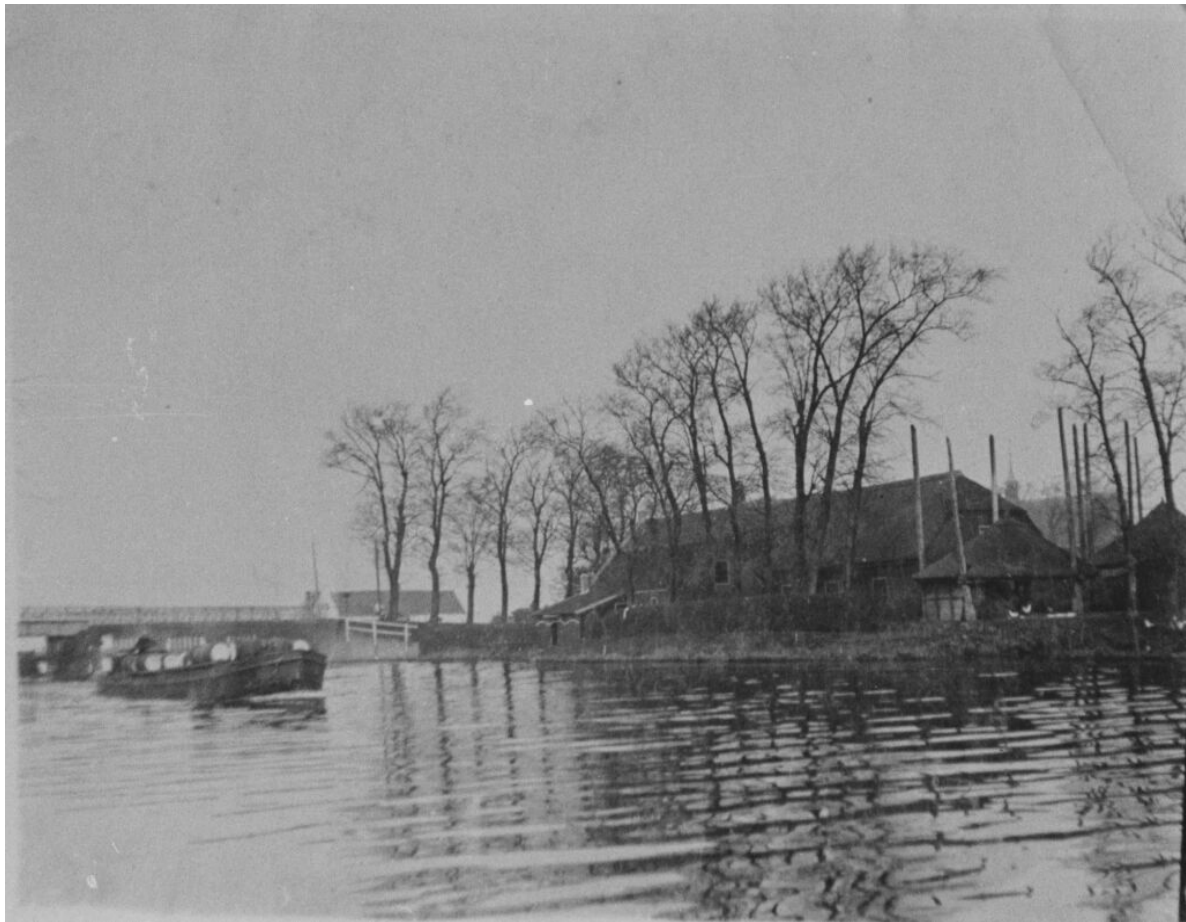
Boerderij "Haaswijk" gezien vanaf het water.