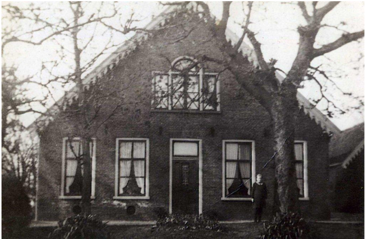
552 Boerderij Boer met Vreugd met onbekend meisje.