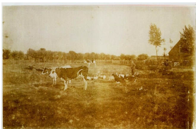
Koeien achter de hofstee Voorbreed circa 1900