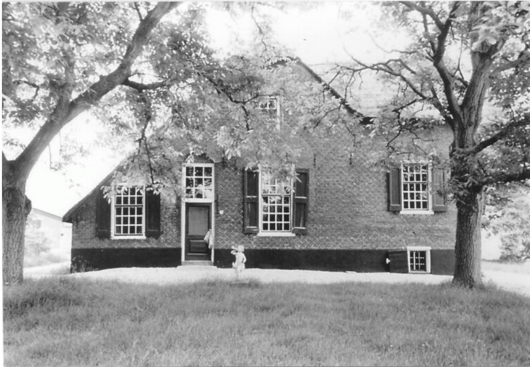
Boerderij "Voorbreed" op Rietveld, foto gemaakt in 1988 foto heeft in "De Rijn en Gouwe" gestaan