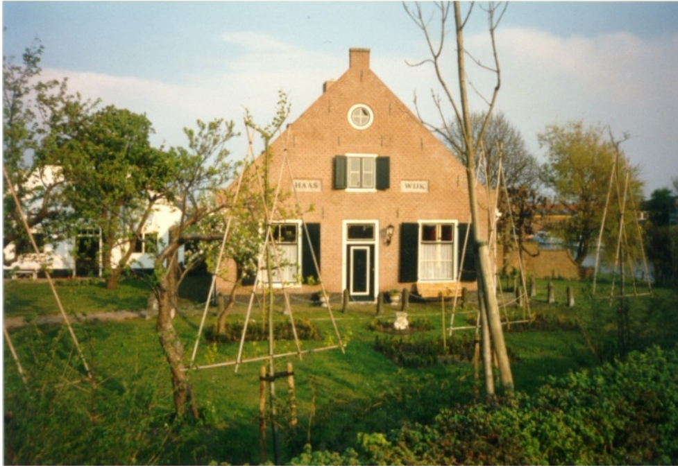
Boerderij "Haaswijk", naast Groene Kerkje